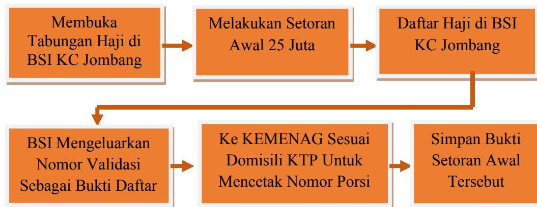
Gambar 1. Flowchart Mekanisme Pendaftaran Haji

Menurut (Jarab, 2023) Istilah Arab "Hajj" atau "haji" mengacu pada perjalanan ke Ka'bah, salah satu kewajiban agama dalam Islam. Ibadah haji, sebagai salah satu pilar Islam, menuntut umat Muslim yang mampu untuk melakukan perjalanan ke Ka'bah selama bulan haji. Hal ini melibatkan serangkaian ritual seperti Ihram, Tawaf, Sa'i, Wakaf, dan Shalat Jum'at. Menurut UU No. 13, tahun 2008, pasal 1, ayat (2), bahwa pelaksanaan ibadah haji adalah rangkaian kegiatan pengelolaan pelaksanaan ibadah haji yang meliputi pembinaan, pelayanan, dan perlindungan jamaah haji. Pelaksanaan haji diawali dengan mekanisme pendaftaran ibadah haji sesuai dengan prosedur dan persyaratan yang telah ditetapkan oleh pemerintah.